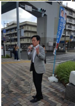
黒川交差点にて 毎週街宣中 7月14日