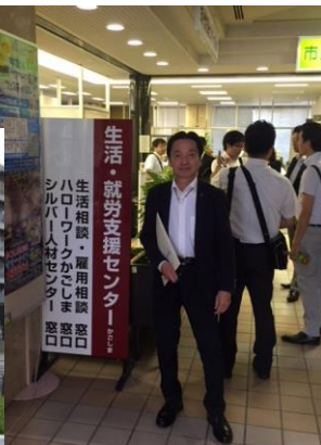
財政福祉委員会 行政視察 鹿児島市 生活・就労支援センターにて 7月12日