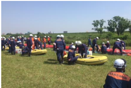
北区水防訓練に参加しました 矢田川河川敷にて 5月27日

全国初の常勤のスクールカウンセラーを配置した「なごや子ども応援委員会」100名を超える体制で1人でも多くの子どもや保護者を応援し、輝く人生を送ってもらいたいと思います。